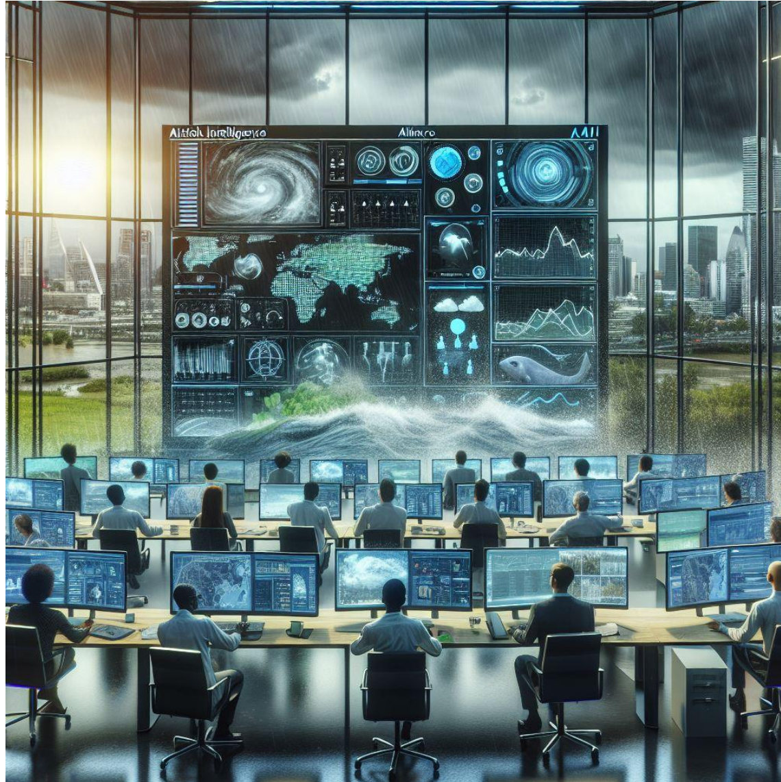
Image created with Microsoft Copilot using input terms: “artificial intelligence”, “flooding” and “forecasting”